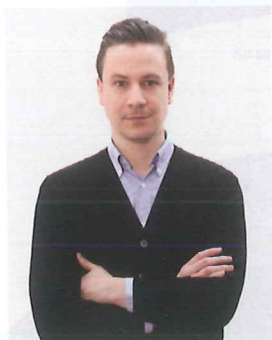
設計師 Sylvain Willenz

SYLVAIN 的設計，可說是比利時年輕一代的設計指標。於首都布魯塞爾出生的他曾先後旅居於美國、比利時、英國等地，於 2004 年返回自己的出生地開設工作室，專注於研究不同的實驗物料。他與 TAMAWA 合作的設計 LOCK COAT-STAND 便以人造樹膠為材，融合創意，顛覆了衣架的概念。他以 2007 年的企劃「COATED」為出發點，運用桌球枱上見到的專用桌球桿及桌球，構想出以三腳鼎立方式撐起，線條簡樸俐落的支架。設計利用特殊切割技術，讓三枝實木「桌球桿」同時穿過巨型的桌球，玩味甚濃，吸引大小朋友的眼球。最為厲害的是設計只以桌球底的一粒螺絲作穩固，實在讓人匪夷所思。LOCK COAT-STAND 備有鮮橙、純黑、桃粉紅、深紅等多款色調，以配合用家居室風格。