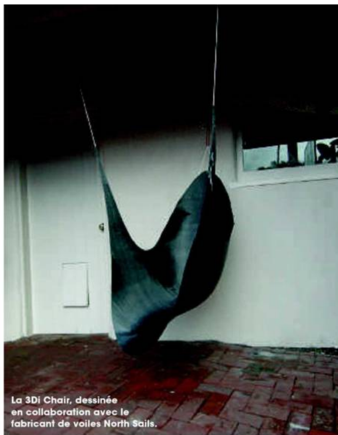
La 3Di Chair, dessinée en collaboration avec le fabricant de voiles North Sails.

SON DESIGN Cette haute technicité se retrouve dans la 3Di Chair (2011), dessinée en collaboration avec le fabricant de voiles North Sails et faite de rubans de carbone disposés sur un moule rigide, cuits à de hautes températures sous une pression négative pour créer une membrane doublement courbée, à la fois légère et solide. Dans la forme, on est loin de sa Ravioli Chair (Vitra), icône du design, intégrée dans la collection permanente du MoMA.