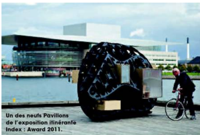
Un des neufs Pavillons de l'exposition itinérante Index : Award 2011.

La Ravioli chair, intégrée dans la collection permanente du MoMA.