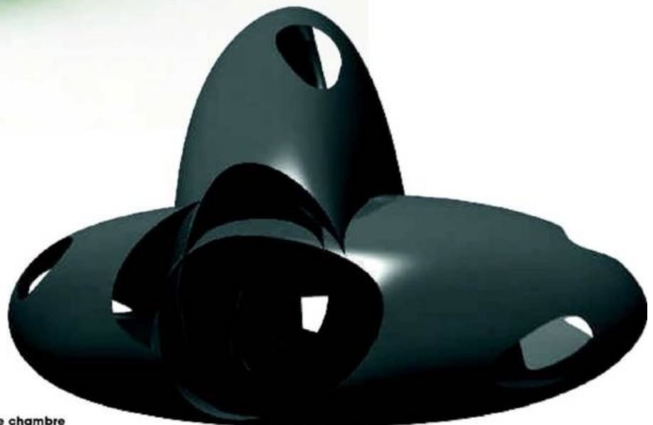
Véhicule de chambre dans le cadre d'Interieur.